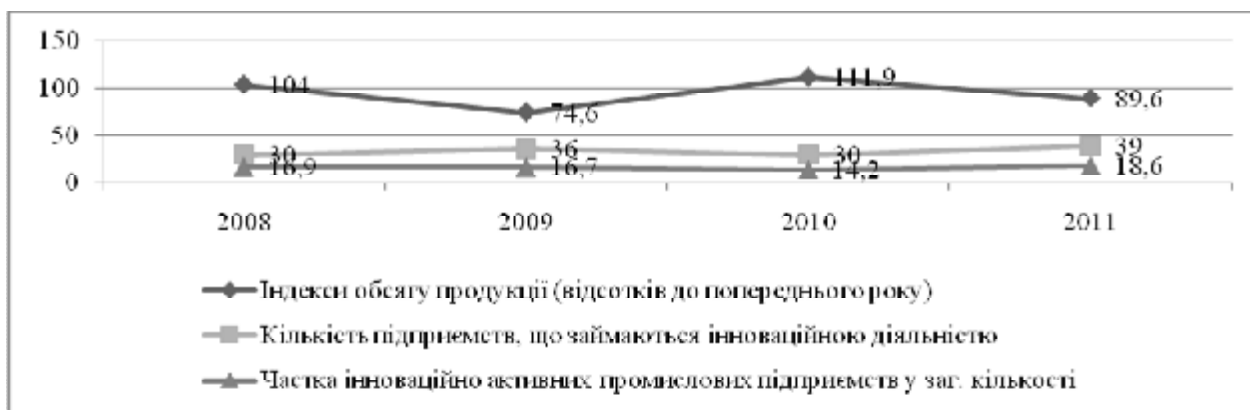
Рис. 2. Порівняльний аналіз інноваційної активності підприємств та темпів росту обсягів виробництва у промисловості за 2008–2011 рр.

Впродовж останніх трьох років інноваційну продукцію реалізовували 22 промислових підприємства області (2008 р. – 19). З них 95,5 % підприємств реалізували продукцію, що є новою лише для підприємства. Питома вага кількості підприємств, які у 2011 р. реалізували інноваційну продукцію, що є новою для ринку, становила 13,6 % від загальної кількості підприємств, що реалізували інноваційну продукцію.