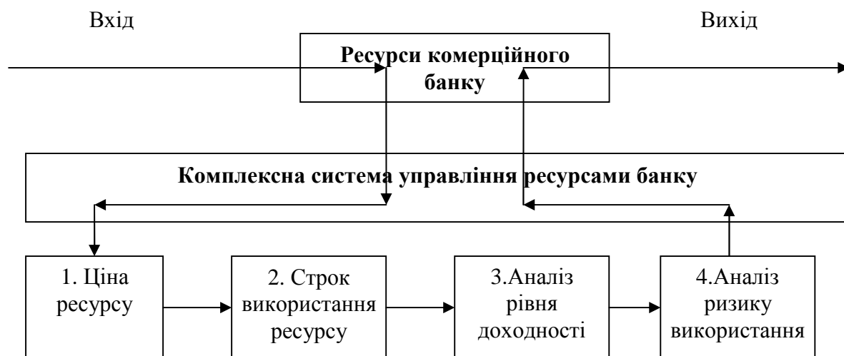
Рис. 2. Комплексна система управління ресурсами комерційного банку [5]

Отже, необхідно оптимізувати використання ресурсів банку для фінансування активних операцій за параметрами строку, обсягу, доходності та ризикованості, оскільки саме дані елементи комплексної системи управління ресурсами комерційного банку визначають ефективність використання залучених ресурсів та здійснюють їх оцінку з позицій забезпечення максимізації прибутковості діяльності банку та мінімізації його витрат на формування ресурсної бази. Банківська установа має ресурси на вході, що проходять через комплексну систему управління ресурсами банку та чотири основних її елементи. На основі даного аналізування визначається якість ресурсу для банку та критерії відбору наступних видів ресурсів, що будуть отримані банківською установою (рис. 2).