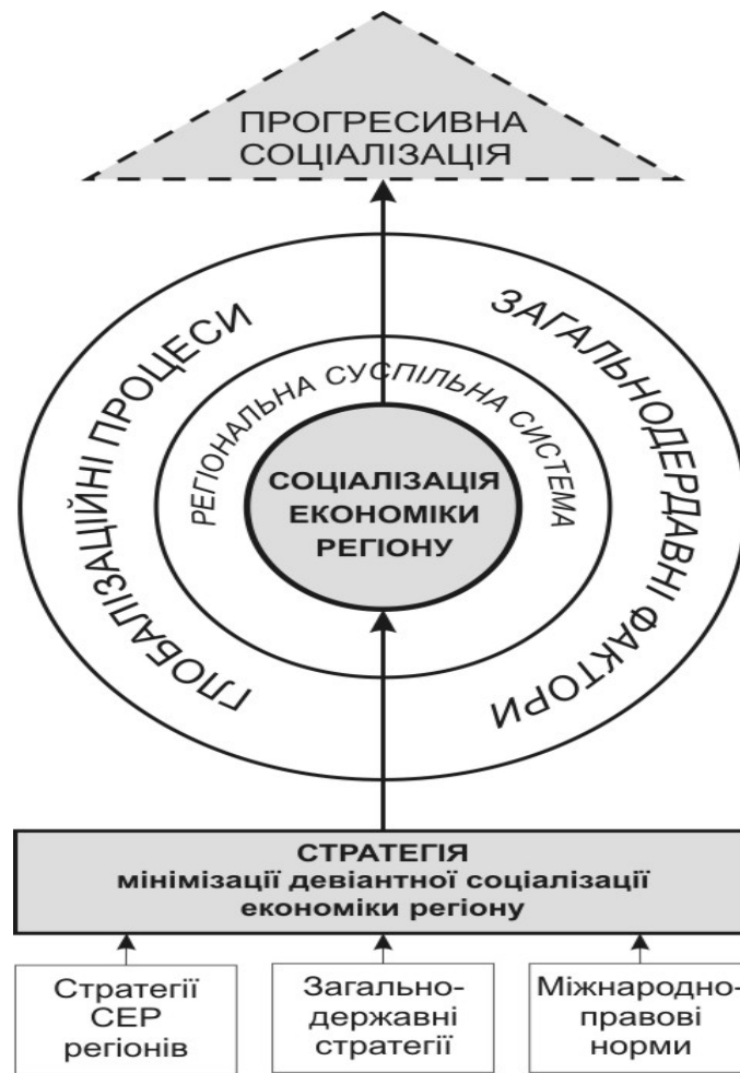
Рис. 1. Механізм реалізації стратегії мінімізації девіантної соціалізації економіки регіону