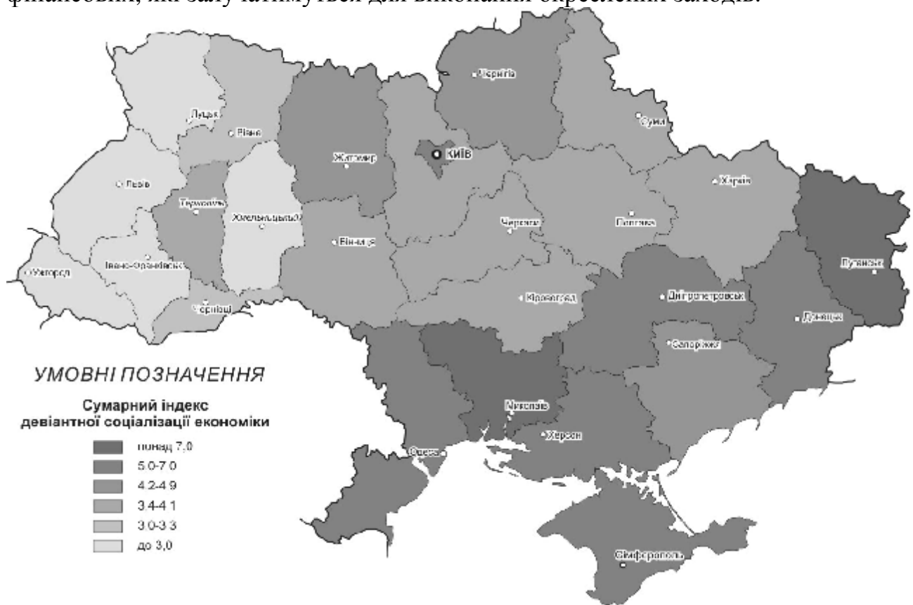
Рис. 3. Регіональні відмінності сумарного індексу девіантної соціалізації економіки

Важливим моментом є визначення обсягу ресурсів, насамперед, фінансових, які залучатимуться для виконання окреслених заходів.