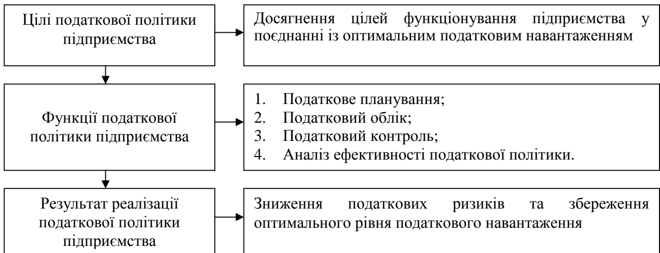
Рис. 2. Цикл реалізації податкової політики підприємства

У цілому податкова політика на підприємстві повинна проходити в декілька етапів: