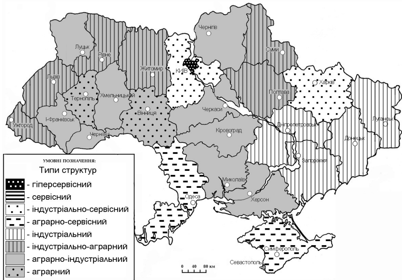
Рис. 2. Регіональні структури зайнятості населення України