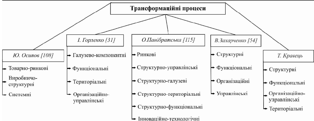
Рис. 1. Трансформаційні процеси господарства