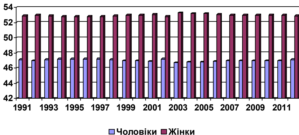
Рис. 1. Динаміка частки чоловічого та жіночого населення Північно-Західного економічного району

*Джерело: Головне управління статистики у Волинській області та Головне управління статистики у Рівненській області