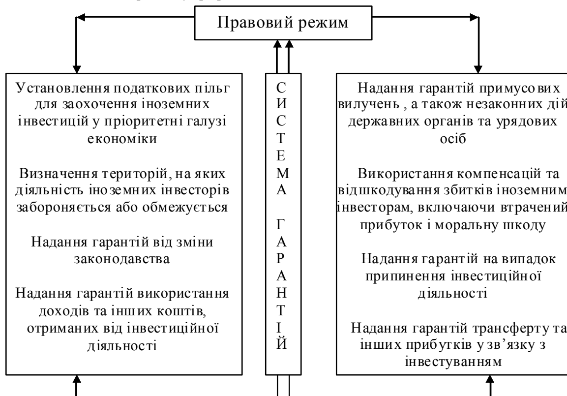
Рис. 2. Система гарантій щодо захисту прав іноземних інвесторів

сфери. Інформаційне забезпечення та центри допомоги іноземним бізнесменам мають інформувати інвесторів про різні проекти й умови їх здійснення за кордоном, систему оподаткування, адміністративно-правові процедури господарської діяльності та ін.