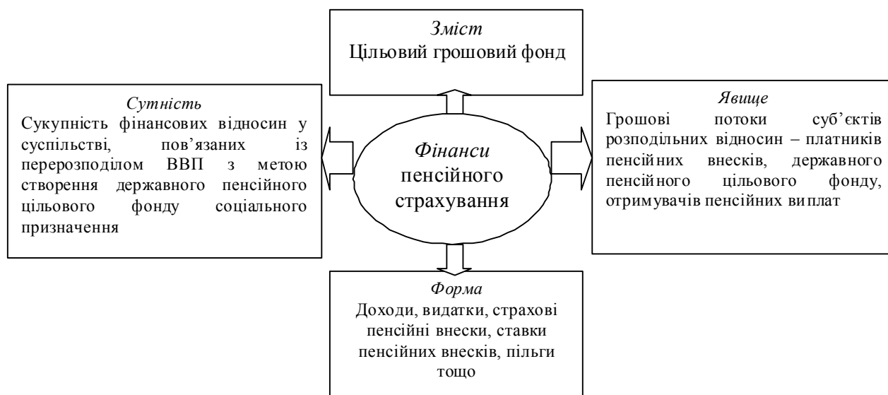
Рис. 2. Взаємозв'язок та відмінності між категоріями фінансів пенсійного страхування * Складено автором на основі джерела [11, с. 19: 21].

Отже, фінанси пенсійного страхування як явище, це грошові потоки платників страхових пенсійних внесків, пенсійного державного цільового фонду, які такі внески акумулюють і використовують, та отримувачів різних видів пенсійних виплат.