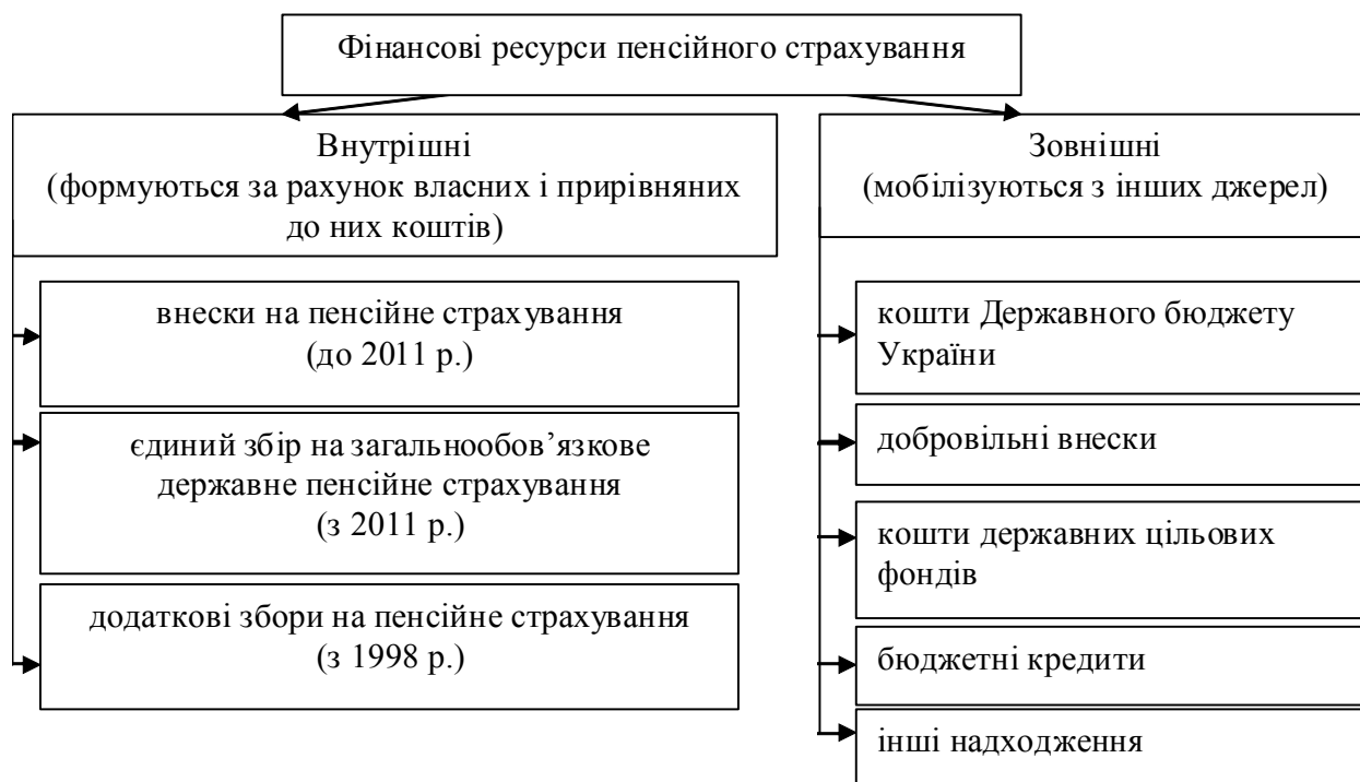
Рис.4. Структура внутрішніх і зовнішніх фінансових ресурсів пенсійного страхування Складено автором самостійно

У контексті розгляду питання про фінансові ресурси будь-якого суб'єкта фінансових відносин (у тому числі держави) доцільно здійснити оцінювання їхньої фінансової збалансованості, тобто досягти такого стану розподілу і використання, який забезпечить незалежність цього суб'єкта від зовнішніх джерел фінансування [12, с. 82]. Такий стан характеризується (визначається) платоспроможністю, тобто здатністю своєчасно погашати свої платіжні зобов'язання [13, с. 116].