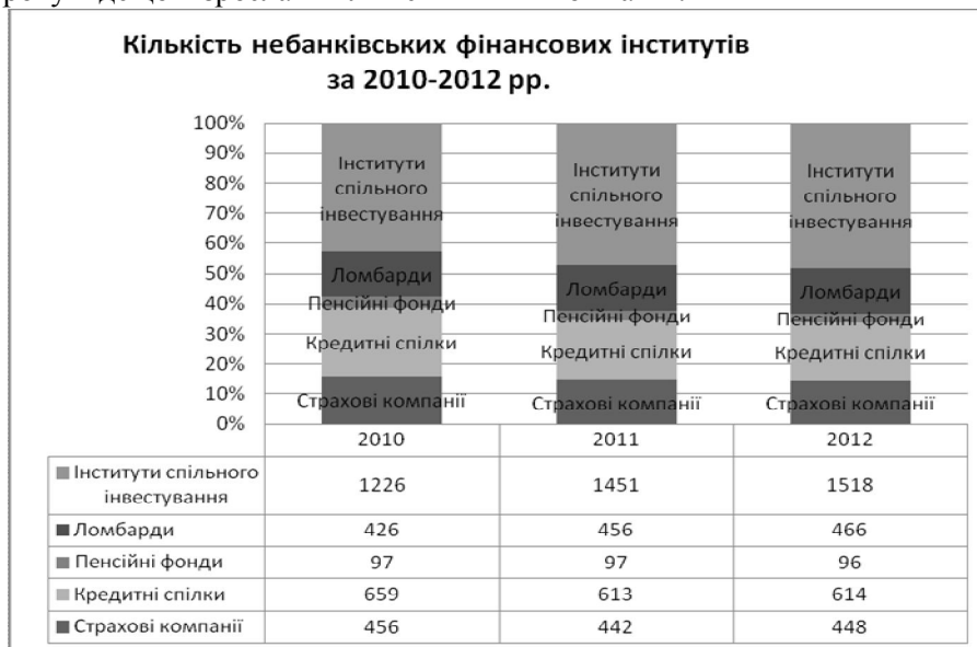
Рис. 2. Кількість небанківських фінансових інститутів за 2010-9 міс. 2012 рр.

Структура кількості небанківських інститутів за 2010-2012 рр. показана на рис. 2. Найбільшу частку небанківських фінансових інститутів складають інститути спільного інвестування, кількість яких збільшується щороку, на відміну від недержавних пенсійних фондів, кредитних спілок і страхових компаній.