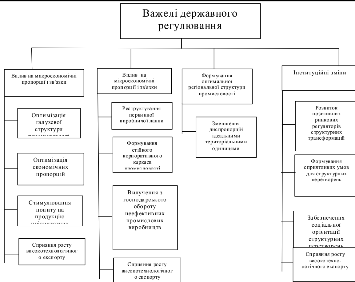
Рис. 2. Важелі державного регулювання регіональних структурних перетворень

зростання наукомістких виробництв, своєчасне науково-технологічне оновлення машинобудування та розвиток різної інфраструктури, а отже, пропорційний розвиток ПЕК у порівнянні з обробною промисловістю);