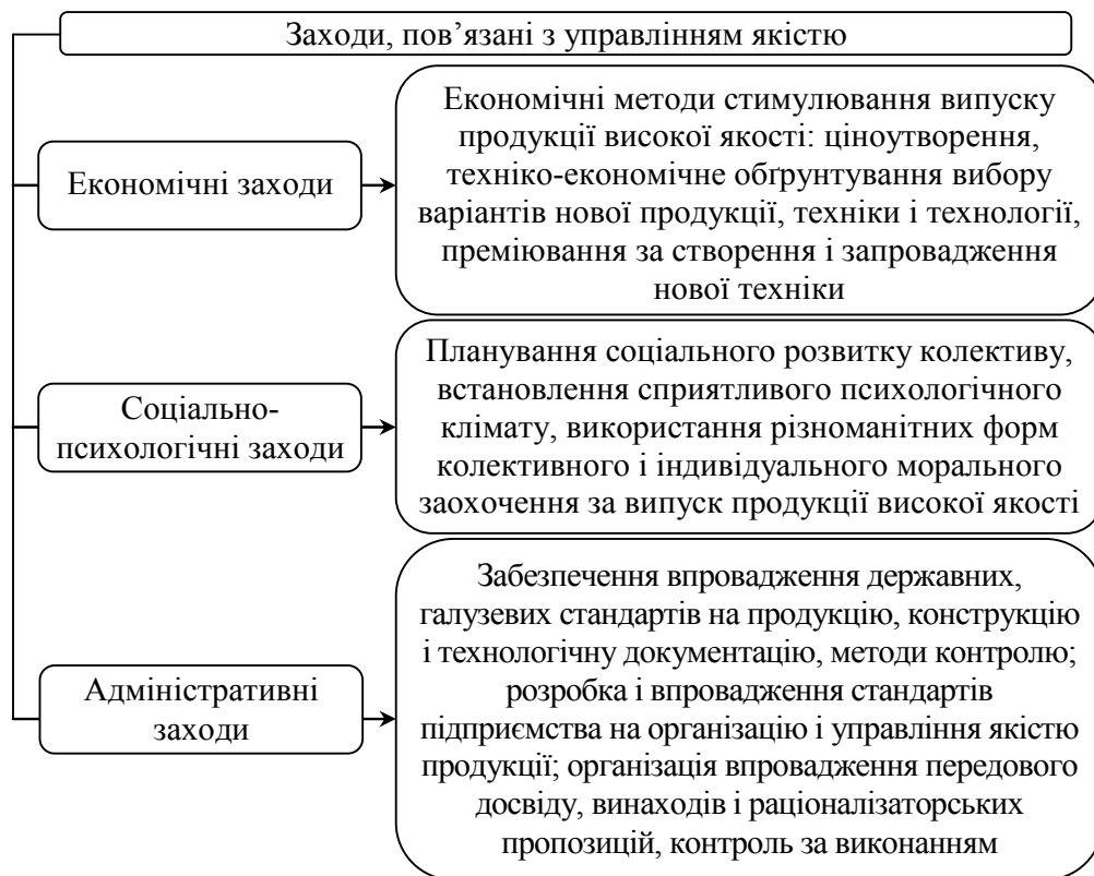
Рис. 2. Заходи, що використовуються з метою управління за якістю продукції

У процесі управління якістю продукції розробляються та виконуються економічні, соціально-психологічні й адміністративні заходи (рис. 2).