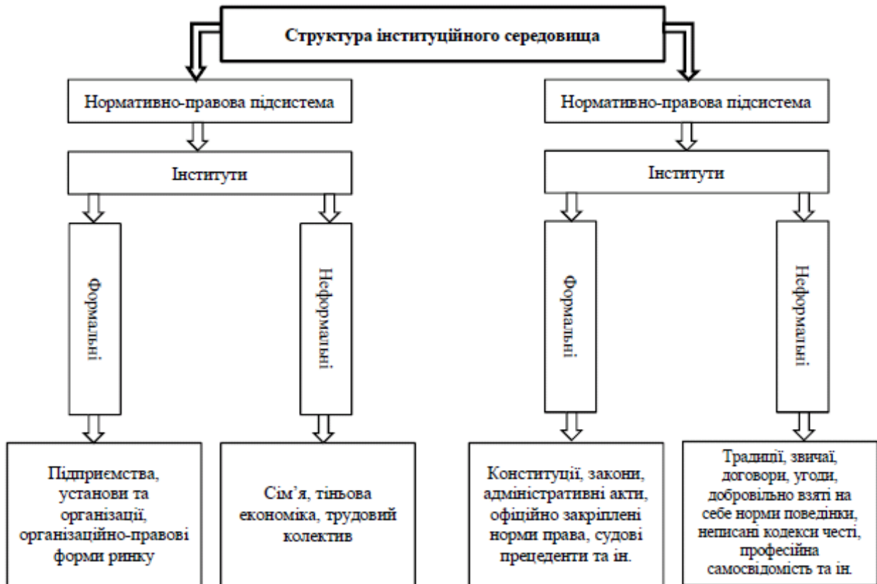
Рис. 1. Структура інституційного середовища