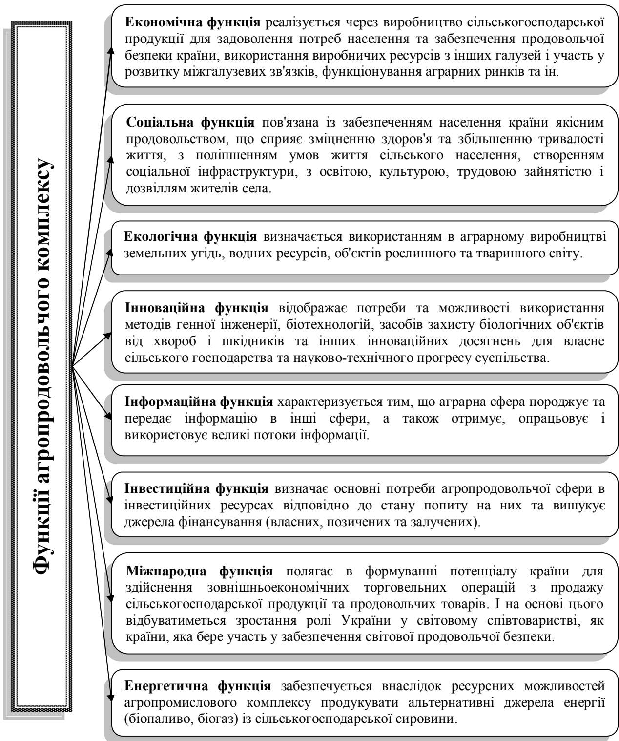
Рис. 2. Основні функції агропродовольчого комплексу та їх характеристика*

* Доповнено автором на основі джерела [5]