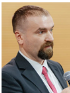
Шаблістий В.В. © доктор юридичних наук, доцент