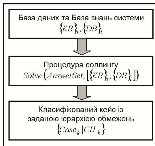
Рисунок 2 – Видобування знань в процесі кейс-солвінгу

Процедура виведення, що імплементується в даному підході, може обробляти обидві дані вимоги. Дана процедура була вперше розроблена як надбудова до Prolog, що дозволяє обробляти петлі на етапах пошуку і, відповідно, відтінати певні можливі виведення відповідно до вагових значень атомів, що виводяться. Залишкові процедури, такі як сортування здійснених рішень ( Solve^{exe} ) і видалення деяких інших обмежень цілісності на атоми виконується в наступних кроках обробки. На рисунку 2 представлена загальна структура системи, а на рисунку 3 деталізовано особливості офлайнових обчислень при побудові бази знань. Додатковим результатом є те, що спроектований фреймворк допомагає користувачу зрозуміти причини та міркування, згідно з якими ті чи інші інстації були асоційовані з виділеним класом.