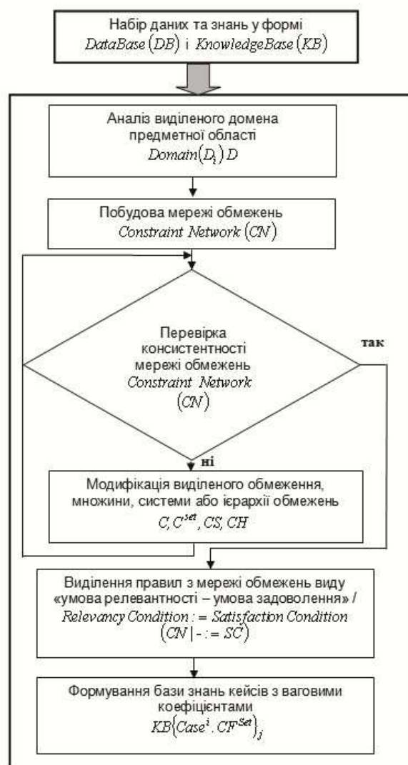
Рисунок 3 – Локалізація процедури побудови БЗ кейсів

Слід відмітити, що всі правила видобуваються автоматично з набору даних, шляхом використання апріорного алгоритму. Єдине, що отримується на вході, – це набір даних і приклад для класифікації. Особливість також полягає в тому, що інформація, яка індукується і використовується абдуктивною системою в загальному випадку, повністю ігнорується класифікаторами на основі дерев рішень.