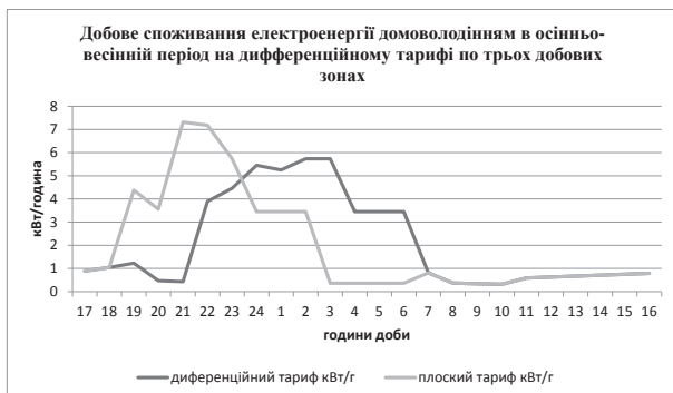
Графік 4. Модель добового споживання електроенергії домогосподарствами в осінньо-весняний період на диференційному тарифі по трьох добових зонах