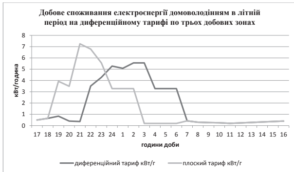
Графік 3. Модель добового споживання електроенергії домогосподарствами в літній період на диференційному тарифі по трьох добових зонах

Модель споживання в рамках запропонованої концепції набуває наступного вигляду. Для літнього та осінньо-весняного періоду маємо наступні години роботи для приладів змінного попиту: пральна машина 00:00-01:00, бойлер 01:00-04:00; посудомийна машина 23:00-00:00; телефони 02:00-04:00; акумулятори для авто 22:00-07:00.