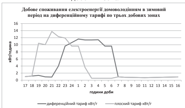
Графік 5. Модель добового споживання електроенергії домогосподарствами в зимовий період на диференційному тарифі по трьох добових зонах

Для зимового періоду години роботи приладів змінного попиту будуть наступні: пральна машина 01:00-02:00, бойлер 02:00-05:00; посудомийна машина 00:00-01:00; телефони 02:00-