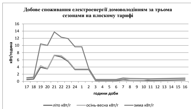
Графік 2. Модель добового споживання електроенергії домоволодінням за трьома сезонами на плоскому тарифі

Оскільки в модель було покладено принцип комбінованого теплопостачання на основі акумуляторів електричного типу, то моделювання попиту, зокрема в зимовий період, підтвердило припущення про необхідність накладення жорсткого обмеження на споживання електроенергії в години вечірнього піку (графік 2).