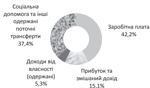
Рис. 1. Структура доходів населення у 2012 р.

Виклад основного матеріалу дослідження. Визначальним чинником попиту споживачів є рівень доходів населення. Протягом останніх років структура доходів населення залишалася майже незмінною. Станом на 2012 р., як і раніше, домінуючі позиції в ній посідали заробітна плата (близько 43%) і соціальні виплати (близько 38%) (рис. 1).