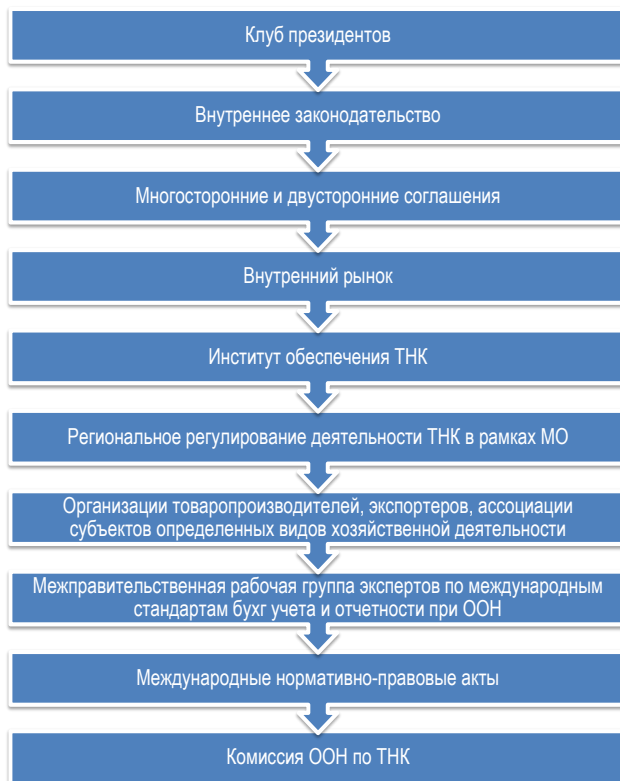
Рис. 2. Иерархия формальных норм институционального обеспечения ТНК

Как изложено в Таблице 2, институциональное обеспечение деятельности ТНК подразделяется на прямое и косвенное, а также формальные институты и неформальные. Далее на Рисунке 2 показана иерархия формальных норм институционального обеспечения ТНК.