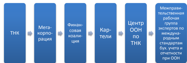
Рис. 3. Уровни регулирования ТНК

Таким образом, локальное институциональное обеспечение осуществляется на уровне компании клубом президентов, в то время как на глобальном уровне – комиссией ООН по ТНК.