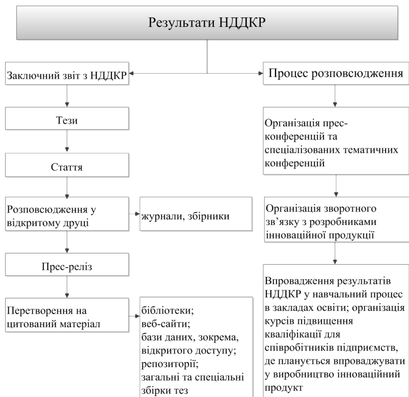
Рис. 2. Організація розповсюдження наукових результатів

По-друге, науково-дослідні установи в Україні є неприбутковими організаціями. Це означає, що