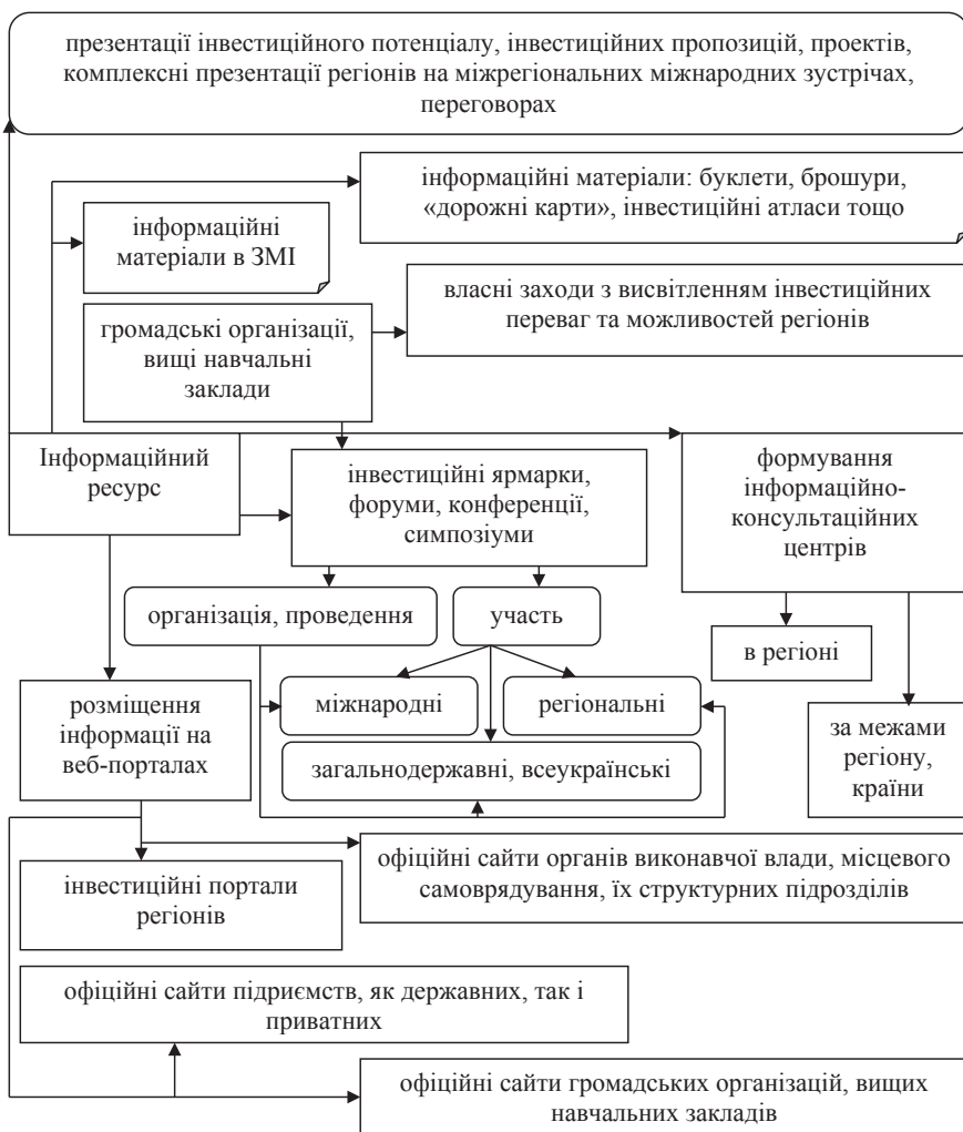
Рис. 1. Способи використання інформаційного ресурсу як інструменту залучення інвестицій на регіональному рівні

Такий напрямок реалізації інвестиційної політики на регіональному рівні є потенційно перспективним та на сьогодні ще недостатньо розвиненим. Проблемними питаннями є обмеженість інформації, неактивне її подання, висвітлення, недостатність інформаційних