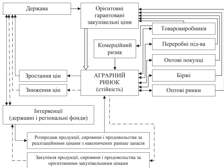
Рис. 3. Державне регулювання цін на аграрному ринку для забезпечення стійкості його розвитку