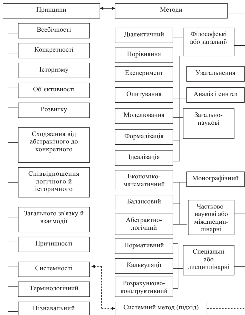
Рис. 2. Схема взаємозв'язку принципів та методів пізнання у дослідженні формування та розподілу доданої вартості у зернопродуктовому підкомплексі