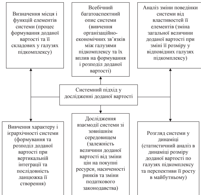
Рис. 3. Системний підхід у дослідженні доданої вартості зернопродуктового підкомплексу