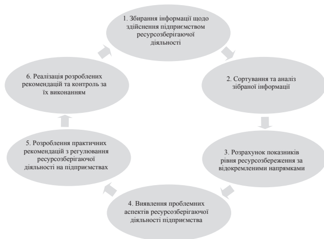
Рис. 1. Етапи стандартної схеми комплексного управління ресурсозберігаючою діяльністю на підприємстві

У загальному випадку схема комплексного управління ресурсозберігаючою діяльністю суб'єктів господарювання може бути подана у вигляді, наведеному на рис. 1 [4].