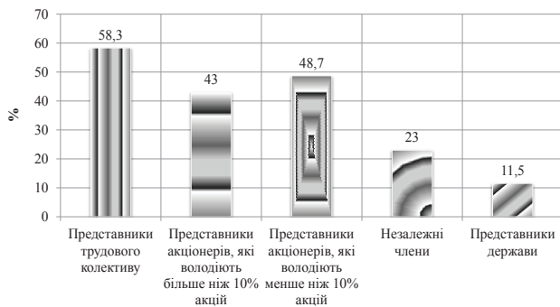
Рис. 2. Розподіл членів наглядової ради за представництвом, % АТ, у яких створено наглядову раду, 2000-2010 рр.

«Харківський завод електромонтажних виробів», «Харківське дослідне конструкторсько-технологічне бюро холодильних машин» наглядові ради виключно складаються з представників даної групи. Така ситуація в першу чергу пов'язана із способом створення цих акціонерних товариств – шляхом приватизації через першочергове розповсюдження акцій серед трудового колективу.