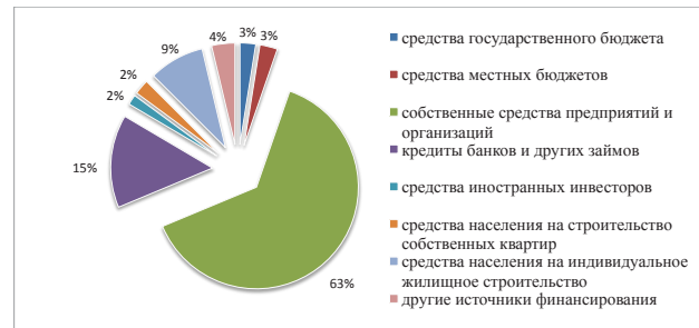
Рис. 1. Капитальные инвестиции по источникам финансирования за январь-декабрь 2013 г.

Так, например, на рис. 1 можно увидеть структуру отечественных капитальных инвестиций по источникам поступления.