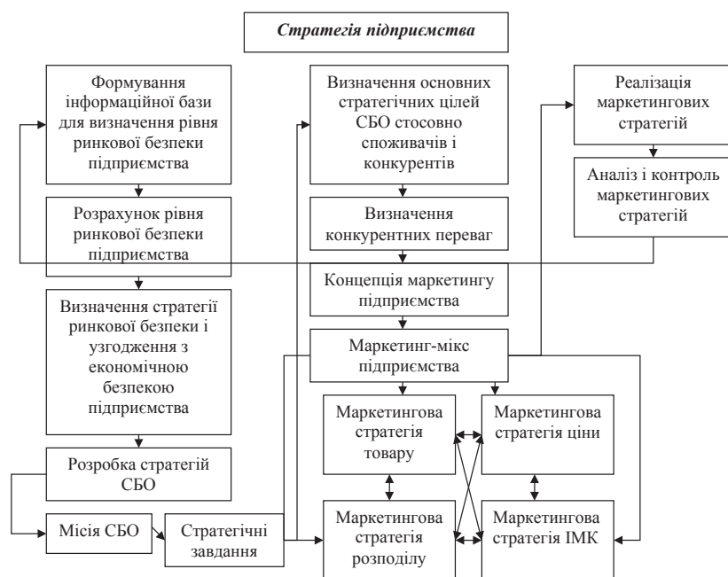
Рис. 2. Модель впливу маркетингового стратегічного планування підприємства на рівень його ринкової безпеки

2. На яких сегментах слід зосереджувати свої зусилля?