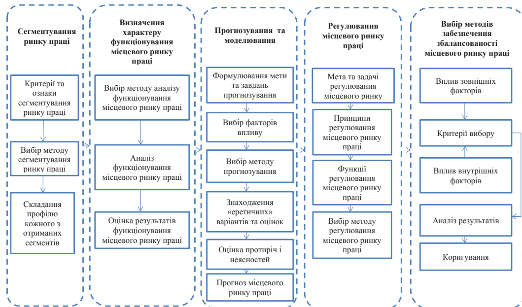
Рис. 1. Модель вибору методів забезпечення збалансованості місцевого ринку праці (авторська розробка)

На сукупну пропозицію місцевого ринку праці впливають фактори, пов'язані з особливостями міста, соціальною структурою населення, демографічні, міграційні, освітні і фінансові. На сукупний попит впливають фактори, пов'язані з особливостями міста, політико-правові, економічні, інноваційно-інвес-