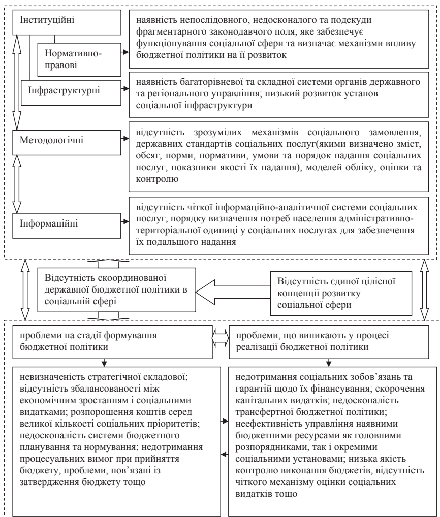
Рис. 2. Основні проблеми механізму формування та реалізації державної бюджетної політики в соціальній сфері

Досить ґрунтовний аналіз причин неефективності бюджетної політики саме з позиції основних етапів бюджетного процесу проведений С.М. Фроловим [10]. Разом з цим проблеми, які виникають на окремих стадіях бюджетного процесу, мають різний характер та можуть бути згруповані в розрізі організаційного, нормативно-правового, інформаційного та методологічного аспектів механізму (рис. 2).