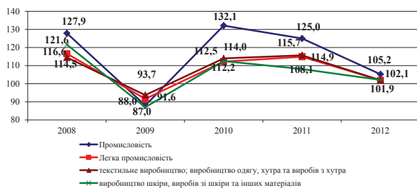
Рис. 1.2. Динаміка темпів зростання (спаду) обсягів реалізації продукції підприємств легкої промисловості в Україні за 2008–2012 рр.

Аналіз даних показує, що в 2009 р. в у діяльності підприємств швейної промисловості, що подолали кризу, пов'язану з переходом країни на ринкові відносини, спостерігаються позитивні тенденції. Однак у 2005–2009 рр. обсяги виробництва швейної продукції знижувалися. Найнижчого значення індекс обсягів швейного виробництва досяг у 2009 році і становив 72% до попереднього року. Аналогічні показники простежуються у легкій промисловості та промисловості загалом.