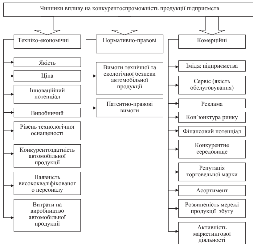
Рис. 1. Класифікація чинників конкурентоспроможності продукції автомобілебудівних підприємств

економічні, нормативно-правові та комерційні. Техніко-економічні чинники включають якість, ціну реалізації та витрати на виробництво автомобільної продукції, рівень технологічної оснащеності, забезпечення висококваліфікованим персоналом, що в сукупності впливає на виробництво якісної продукції. У свою чергу, комерційні фактори включають кон'юнктуру ринку, рівень обслуговування, розвиток маркетингової діяльності на підприємстві, наявність і дієвість рекламної політики, імідж підприємства та репутація торговельної марки, що характеризує умови реалізації автомобільної продукції на конкретному ринку.