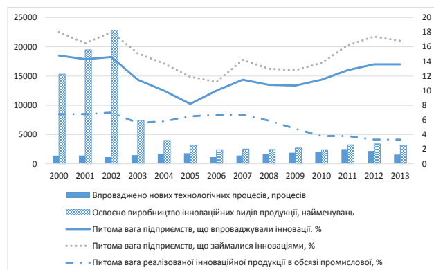
Рис. 2. Впровадження інновацій на промислових підприємствах України упродовж 2000-2013 рр.

Результатом інноваційної діяльності є впровадження інновацій та їх комерціалізація. Спостерігається нестійка тенденція зміни впровадження нових технологічних процесів та освоєних інноваційних видів продукції. Так, упродовж 2003-2006 рр. спостерігається спад активності, а з 2007 р. незначне збільшення впровадження нових технологічних процесів. У діапазоні 2,4-7,4 тис. найменувань коливається виробництво інноваційної продукції. При цьому при збільшенні питомої ваги підприємств, що впроваджували інновації, частка реалізованої інноваційної продукції зменшується і становить 3,3% у 2012 й 2013 рр. (рис. 2).