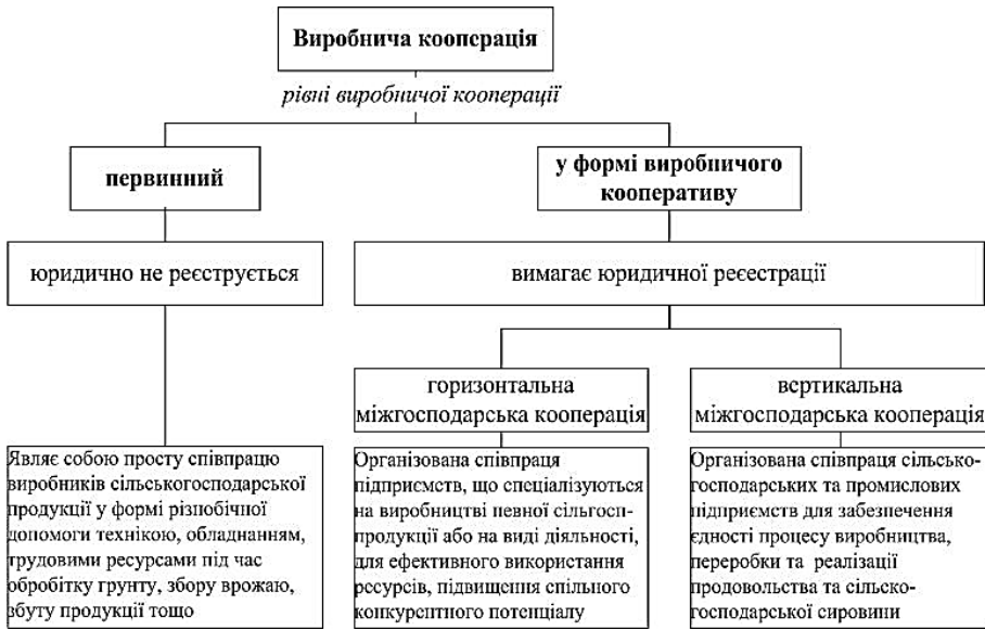
Рис. 1. Сучасний розвиток виробничої кооперації в Україні

Вищою формою виробничої кооперації є створення сільськогосподарського виробничого кооперативу як добровільного об'єднання осіб на основі членства для сумісної виробничої і іншої господарської діяльності, заснований на їх особистій трудовій участі і об'єднанні їх майнових пайових внесків. М. Малік вказує на те, що виробничий кооператив виник шляхом повної інтеграції господарств-членів кооперативу в єдине підприємство, в якому об'єднуються спільні індивідуальні зусилля. Унаслідок цього виробничий кооператив є найбільш інтенсивною формою згуртованості й вищим ступенем інтеграції в кооперативному секторі. Чле-