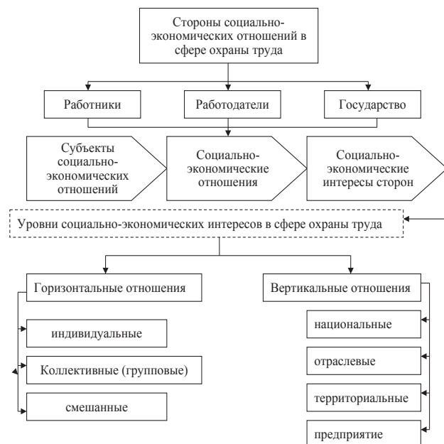
Рис. 2. Система социально-экономических отношений в сфере охраны труда

Главными сторонами социально-трудовых отношений в сфере охраны труда выступают работники, в частности, наемные работники, работодатели, государство или органы местного самоуправления (рис. 2).