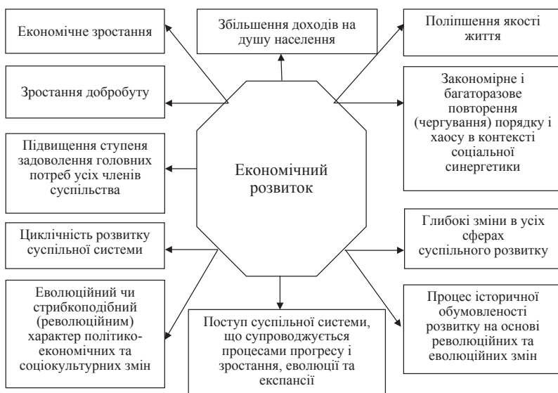
Рис. 2. Трактатування поняття «економічний розвиток»

Наступний інвестиційний підхід до соціально-економічного розвитку висловлює академік Геєць В.М., який вважає, що модель економічного розвитку, яка зводиться до стимулювання платоспроможного попиту населення через бюджет, вичерпала себе. В її межах підтримується не інвестиційний, а платоспроможний попит населення, включаючи надходження від позик і трансфертів від оstarбайтерів. Зокрема, державні позики спрямовуються на підвищення доходів найбідніших прошарків населення, котрі витрачають ці кошти на придбання товарів першої потреби, включаючи імпортні. У зв'язку з