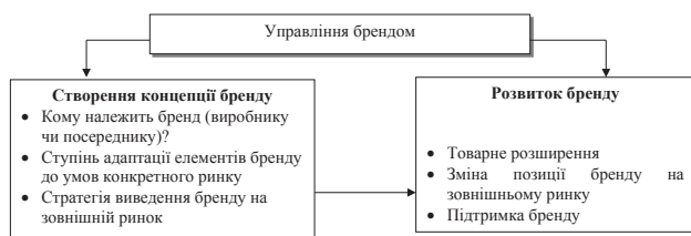
Рис. 1. Управлінські рішення стосовно бренду в процесі інтернаціоналізації компанії

До процесу розробки бренду необхідно підходити комплексно, у відповідності до законів семонеміки, беручи до уваги всі фактори, що пов'язані з маркетингом та юридичним захистом бренду. Однак, в українській практиці у створенні фірмових назв та брендів закони семонеміки практично не використовуються. Це пов'язано з тим, що відомих вітчизняних брендів поки що мало, тому нові назви можуть формуватися на основі використання існуючих слів, понять, позначок, хоча загальних правил розробки успішних брендів необхідно дотримуватися: бренд повинен мати індивідуальність, охороноздібність, легко перекладатися на інші мови, легко розпізнаватися та мати рекламоздібність.