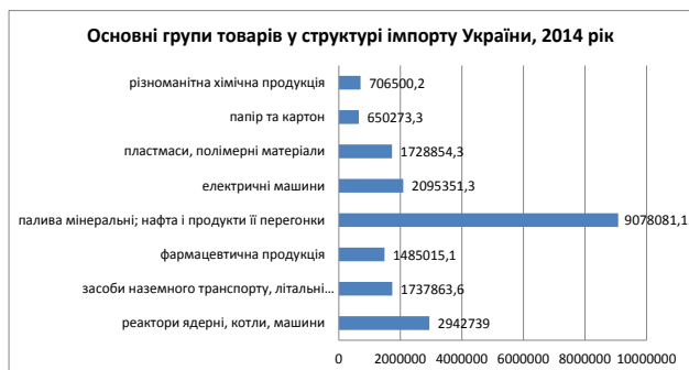
Рис. 4. Основні групи товарів у структурі імпорту України, 2014 рік

Висновки. Інтеграція України у світовий економічний простір дає змогу вийти українським виробникам на нові ринки збуту та збільшити загальне виробництво і експорт. Перед Україною стоїть складне завдання – влитися в єдиний європейський економічний простір. ЄС надав преференції в торгівлі, але, на жаль, українська сторона в експорті товарів ще не скористалася належним чином цією перевагою, натомість в експорті послуг ситуація кардинально відрізняється. Експорт товарів за перше піврччя 2014 року порівняно з аналогічним періодом 2013 року скоротився на 14,2%, імпорт знизився на 20,2%, сальдо зросло на 17,1%.