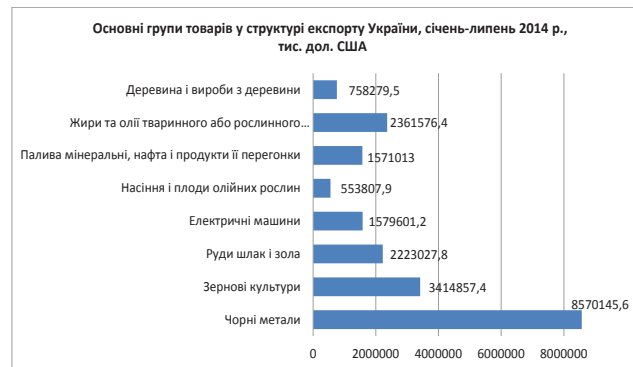
Рис. 3. Основні групи товарів у структурі експорту України, січень-липень 2014 р., тис. дол. США

су – руда та чорні метали, та продукція сільськогосподарства, і необроблена – пшениця, кукурудза, насіння соняшнику, і оброблена – соняшникова олія [7].