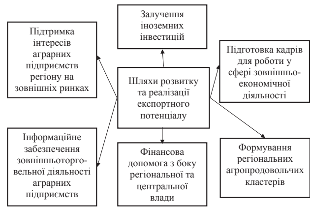
Рис. 2. Запропоновані шляхи розвитку та реалізації експортного потенціалу аграрного сектору економіки Миколаївської області

Успішне просування інтересів суб'єктів зовнішньоекономічної діяльності регіону на зовнішні ринки буде сприяти оптимізації структури економіки, створенню впізнаваної системи унікальних особливостей