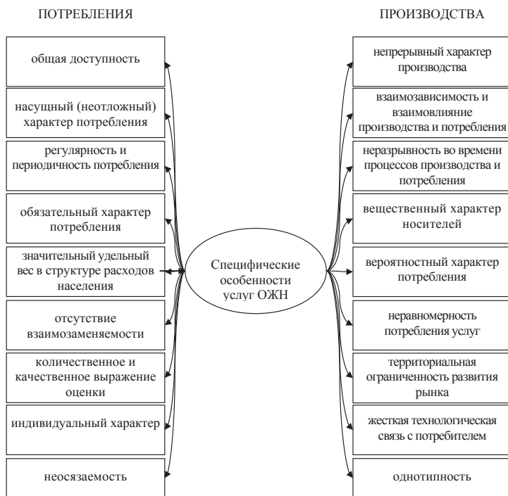
Рис. 4. Характеристики услуг ОЖН как вида хозяйственной деятельности и как товара

Выводы из проведенного исследования. По результатам выполненного диалектического анализа можно сделать следующие выводы. Исследование услуги как экономической категории свидетельствует, что в экономической науке не сложилось единого подхода к пониманию ее сущности. Услуги определяются как действия, деятельность, экономическое благо, функции, экономические отношения, изменение институциональной единицы. Возможность выработки единого понятия услуги через сочетание в нем всех существующих понятий сомнительна: остаточный принцип формирования сектора услуг повлиял на неконкретность и абстрактность этой экономической категории. Кроме того, услуга – это гибкий объект, пределы которого не являются стабильными. Выполненная в рамках исследования систематизация существующих концепций понимания сущности услуг, позволила выделить несколько подходов и выяснить, что наибольшее распространение