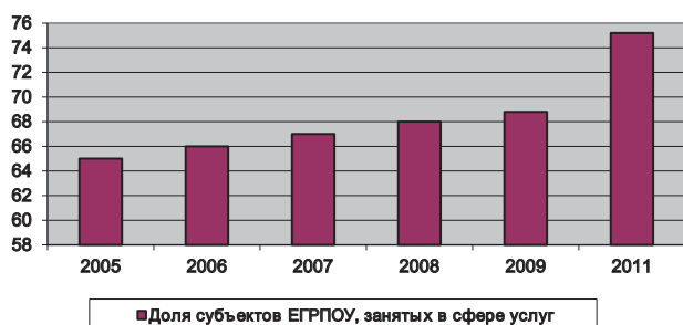
Рис. 1. Изменение доли субъектов ЕГРПОУ, занятых в сфере услуг, в % к общему количеству субъектов ЕГРПОУ

Предприятия сферы услуг в Украине обеспечивают более 26% национального ВВП, а предприятия, занятые в производстве и распределении электроэнергии, газа и воды, – около 5% 5 .