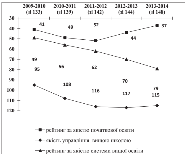
Рис. 1. Динаміка субіндексів (показників розвитку початкової та вищої освіти) глобальної конкурентоспроможності України за 2009–2014 рр.