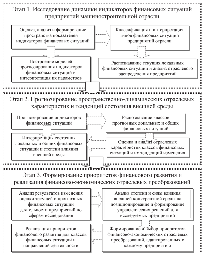
Рис. 1. Этапы механизма управления финансовыми ситуациями промышленных предприятий

Изложение основного материала исследования. Предлагаемый в работе механизм управления фи-