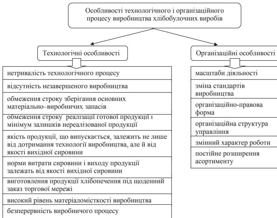
Рис. 3. Особливості технологічного і організаційного процесу виробництва хлібобулочних виробів

Питому вагу серед досліджуваних підприємств Миколаївської області займають товариства з обмеженою відповідальністю та приватні підприємства,