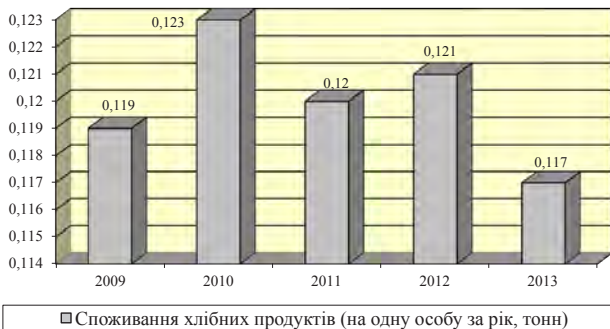
Рис. 2. Динаміка споживання хлібобулочної продукції у Миколаївській області

Обсяг виробництва хліба та хлібобулочних виробів у Миколаївській області має тенденцію до зниження через значне нарощення виробництва хлібопродуктів малими підприємствами, пекарнями, домогосподарствами та власними виробництвами супермаркетів (рис. 2).