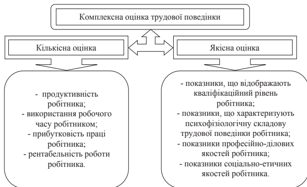
Рис. 1. Оцінювання складових трудової поведінки робітника машинобудівного підприємства*

Оцінювання зовнішньої, кількісної складової трудової поведінки робітника машинобудівного підприємства досить широко представлено у науковій літературі, тому в нашому дослідженні зосередимося на