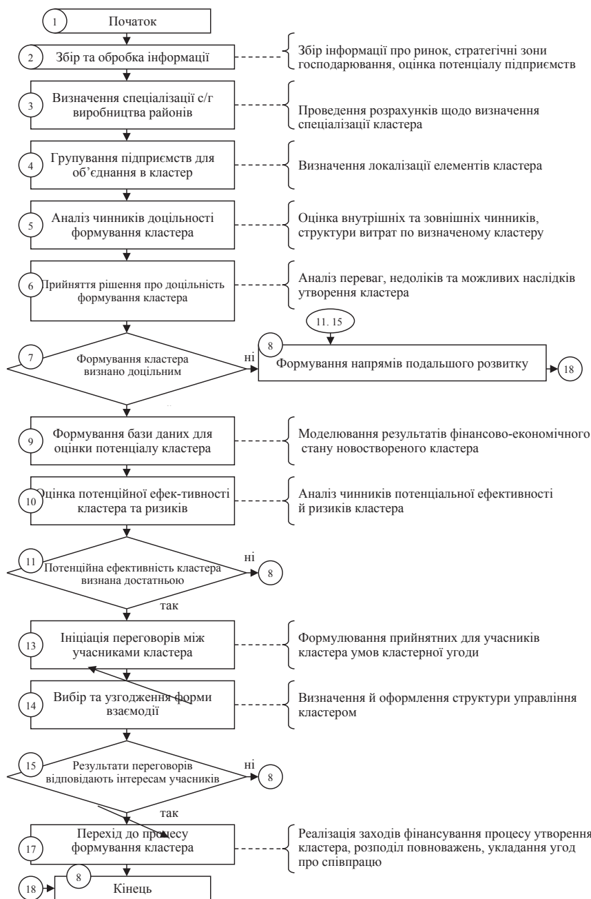
Рис. 2. Алгоритм формування регіонального кластера