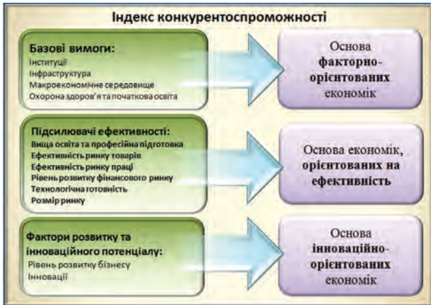
Рис. 1. Складові індексу конкурентоспроможності

ІГК враховує етапи економічного розвитку: велика питома вага надається тим складовим, які відносно більш важливі для поточної стадії економічного розвитку країни. Тобто, незважаючи на те, що усі 12 складових мають конкретне значення для усіх країн, відносна важливість кожної складової залежить від того, на якому етапі перебуває країна.