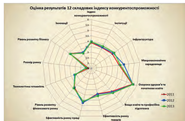
Рис. 3. Оцінка 12 складових індексу конкурентоспроможності Миколаївської області

Для того щоб визначити причини падіння Миколаївської області в загальному рейтингу, необхідно проаналізувати складові індексу конкурентоспроможності (рис. 3).