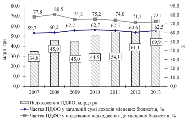
Рис. 3. Роль податку на доходи фізичних осіб у формуванні доходів місцевих бюджетів України (без урахування міжбюджетних трансфертів)

Як видно з даних рисунка 3, податок на доходи фізичних осіб відіграє основну роль при формуванні доходів місцевих бюджетів. Його частка у загальній сумі доходів місцевих бюджетів України з 2007 року (59,7%) по 2010 рік (62,7%) мала тенденцію до зростання після реформування механізму справляння податку. У 2012 році порівняно з 2011 роком частка податку на доходи фізичних осіб у загальній сумі доходів місцевих бюджетів України скоротилася до 60,6%.