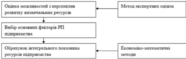
Рис. 1. Методично-практичні положення щодо оцінки ресурсного потенціалу підприємства

Методико-практичні положення щодо оцінки ресурсного потенціалу підприємства повинні базуватись на (див. рис. 1):