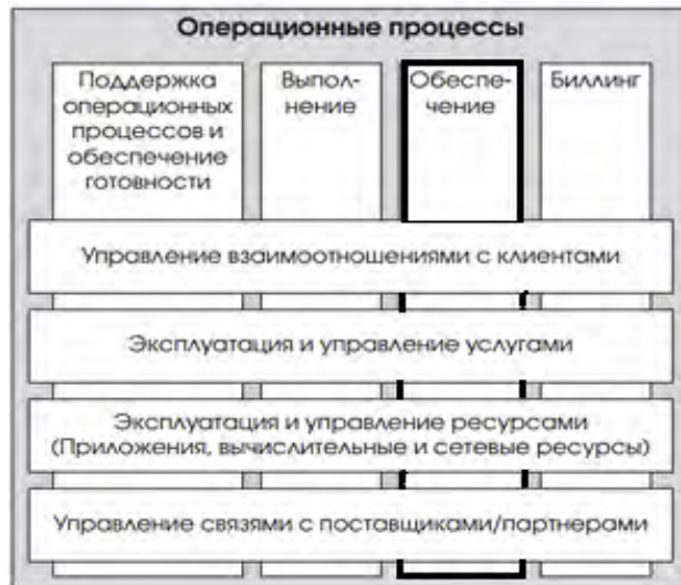
Рис. 2. Операционные процессы в модели eTOM уровня 1

Процессы «Обеспечение» (англ. Assurance) отвечают за принятие реагирующих и превентивных мер для того, чтобы обслуживание абонента происходило без сбоев и удовлетворяло требованиям качества обслуживания (англ. Quality of Service, QoS) и соглашению об уровне обслуживания (англ. Service Level Agreement, SLA). Другими словами, «Обеспечение» – это блок процессов, отвечающих за управление качеством (выделено на рис. 1). Эти процессы осуществляют непрерывный мониторинг состояния