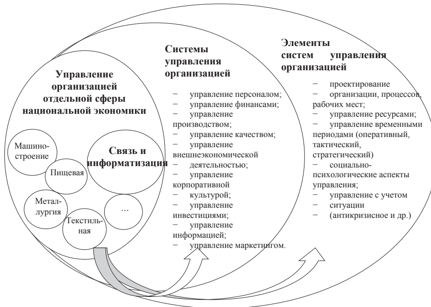
Рис. 1. Система управления организацией

Сфера связи и информатизации является важнейшей составляющей национальной экономики каждой промышленно развитой страны, а средствам коммуникации и информатизации сегодня отводится особая роль в формировании единого информационного пространства. Процессы глобализации инфокоммуникационных сетей определяют необходимость становления и развития системы управления качеством телекоммуникационных услуг. С развитием информационно-инновационного общества происходит повышение требований к качеству услуг со стороны потребителей, что в свою очередь диктует новые условия обеспечения успешного функционирования оператора телекоммуникаций. Все развитые системы управления имеют в своем составе подсистемы или модули для их решения. Необходимо, чтобы процессы, рассматриваемые при разработке таких систем управления качеством,