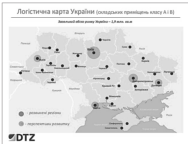
Рис. 3. Схема розміщення складських приміщень за 2013 рік класу А та В на території України

На рисунку 3 наведено схему розміщення складських приміщень за 2013 рік класу А та В на території України. Як видно, найбільшу концентрацію складських об'єктів займають м. Київ та Київська область, Донецька, Дніпропетровська, Одеська, Львівська області [5].