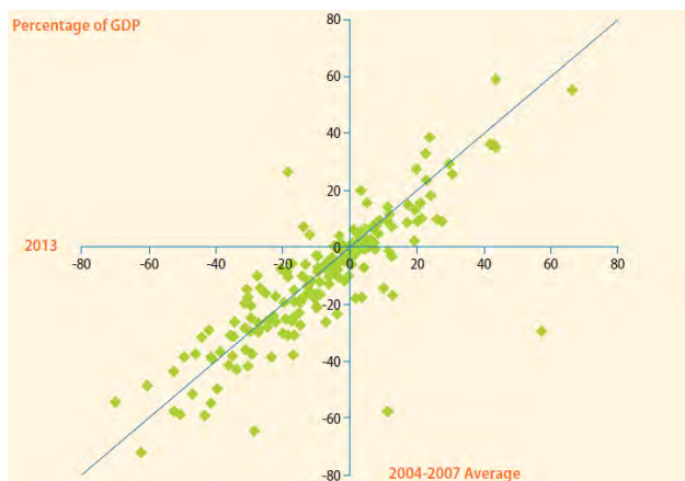
Рис. 3. Баланси товарної торгівлі країн, 2013 р. порівняно з 2004–2007 рр. [8]

Прогнозована експертами ООН картина торгових шоків на 2014–2015 рр. припускає, що перспективи змін до істотних диспропорції у торгівлі товарами обмежені. Очікується, що країни, для яких був характерний дефіцит балансу товарів у 2013 р. і які розташовані ближче до діагональної лінії, не відчують покращень балансу товарів і в найближчій перспективі. Більшість з цих країн – це найменш розвинуті країни, малоефективні експортери сировинних товарів, чисті імпортери енергії і продовольства.